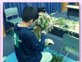
フラワー装飾職種