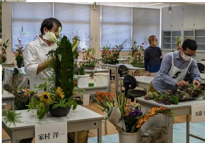
かごしま技能競技大会「フラワー装飾の部」競技風景