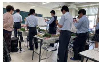
県立薩摩中央高等学校 (フラワー装飾)