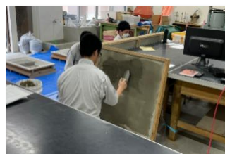
県立鹿児島工業高等学校 (左官)