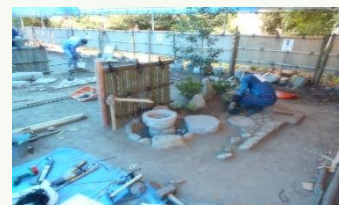
製作等作業試験の様子

一般社団法人日本造園組合連合会鹿児島県支部は、鹿児島分会と奄美分会が設置され、県内の造園業者が集う、造園緑化団体として、技術者の技能の向上、よりよい緑の環境づくりをめざし、様々な活動に取り組んでいます。