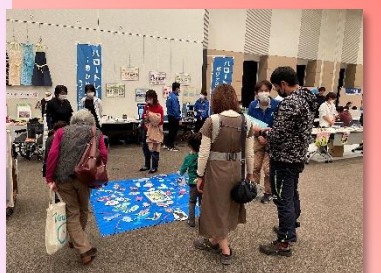
* 職業能力開発施設等コーナー *