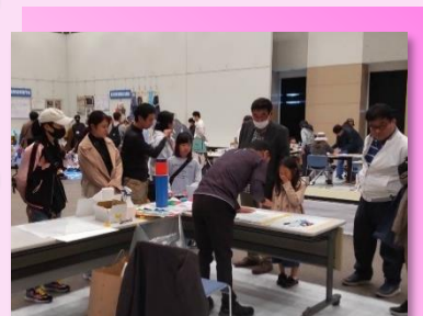
* 製作実演（広告美術）*