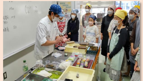
鹿児島市谷山北公民館 （菓子製造）