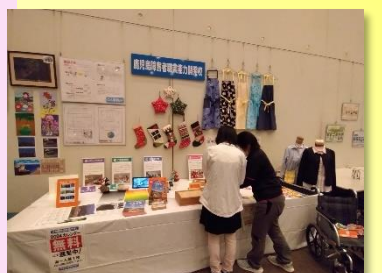
* 職業能力開発施設等コーナー *