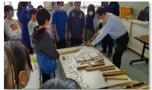
出水市立出水小学校（家具製作）