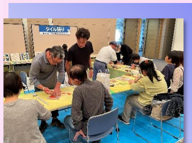
* ものづくり体験* （タイル張り）