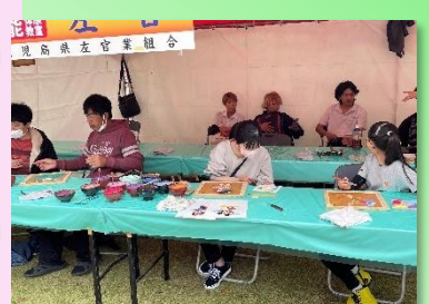
* ものづくり体験* （左官）