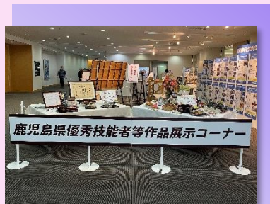
* 優秀技能者等 作品展示コーナー *