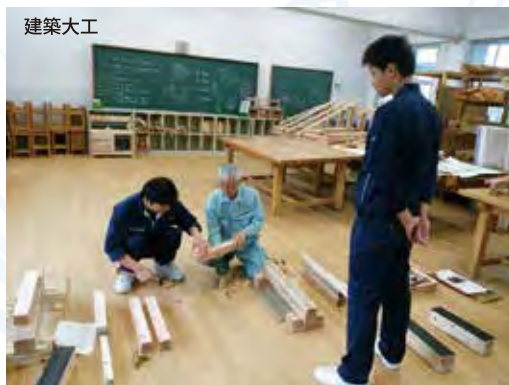
〔派遣による指導風景〕