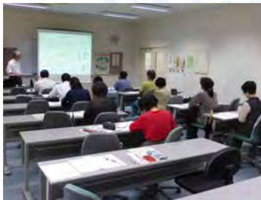
〔ものづくり体験教室風景〕