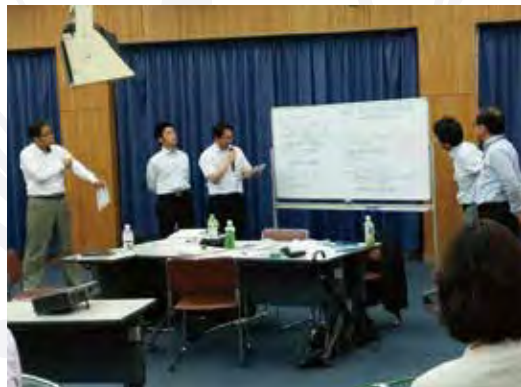
〔インストラクター養成研修風景〕

今別府産業株式会社 / 株式会社 Misumi / 株式会社 指宿フェニックスホテル / 本坊酒造 株式会社 / 社会福祉法人 敬天会 / 南九州酒販 株式会社 / 社会福祉法人 南恵会