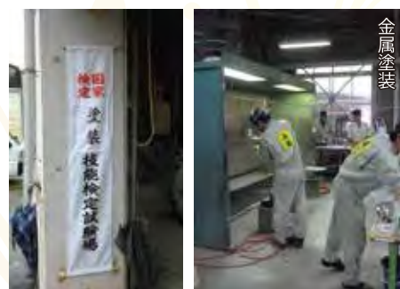
〔技能検定 実技試験風景〕

技能実習制度における技能実習生に対し、習得された技能等についての認定に活用されるものとして、随時に実施する3級、基礎1級及び基礎2級を設定し実施しています。