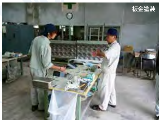
〔指導技法講習風景〕