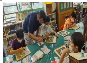
南九州市立知覧小学校 (左官)