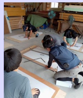
赤瀬川建設株式会社 (建築大工)