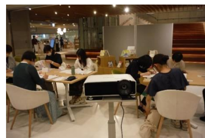
天文館図書館とのコラボイベント 「見つけよう！じぶんらしい働き方」