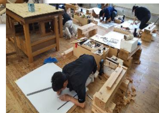
県立加治木工業高校 (建築大工)