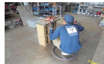
冷凍空気調和機器施工 (随時2級)