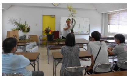
県フラワー装飾技能士会