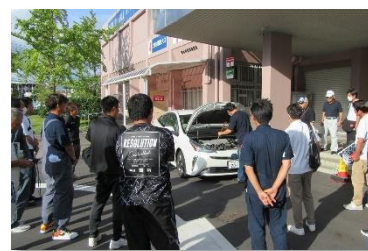
県自動車車体整備協同組合