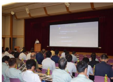
県交通安全施設工事業協会