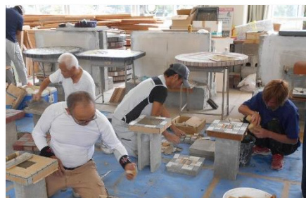
県タイル工業協同組合