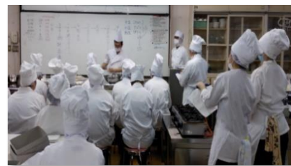
県立野田女子高等学校（パン製造）