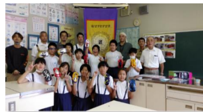
出水市立米ノ津東小学校（工場板金）