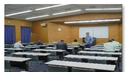
冷凍空気調和機器施工