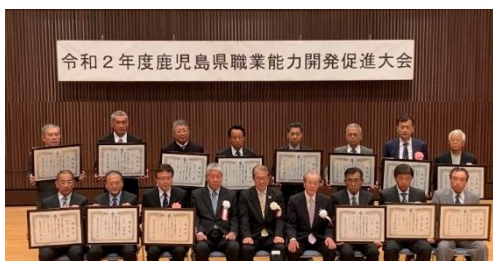
鹿児島県知事表彰受賞者