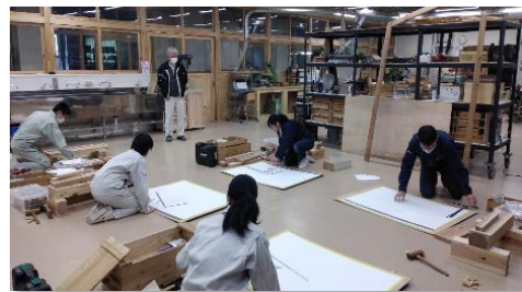
県立鹿児島工業高等学校（建築大工）