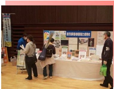
* 職業能力開発施設等 コーナー展示 *