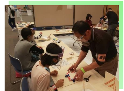
* ものづくり体験教室 * (表装)