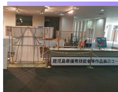
* 優秀技能者等 展示コーナー *