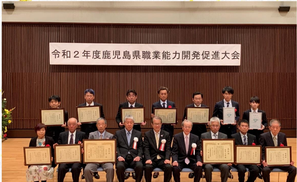
鹿児島県職業能力開発協会会長表彰受賞者