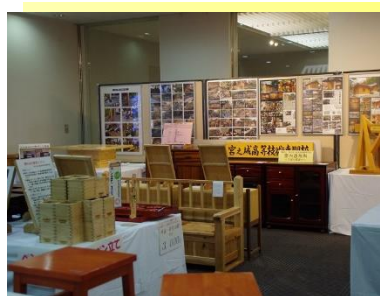
* 職業能力開発施設等 コーナー展示 *