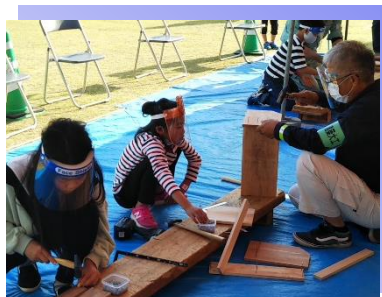
* ものづくり体験教室 * (建築大工)