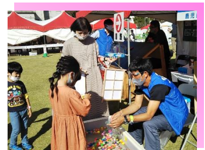
* スーパーボールすくい *