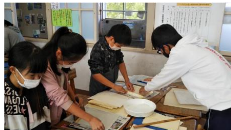
出水市立出水小学校（表装）