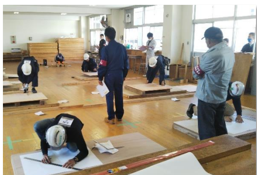
随時試験 型枠施工職種