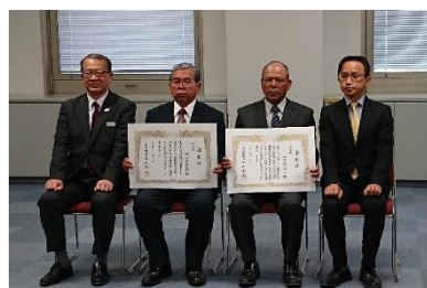
厚生労働大臣表彰受賞者