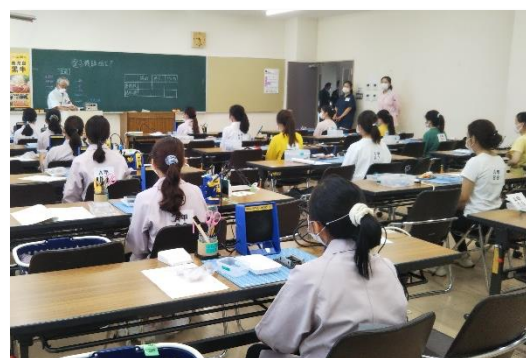
随時試験 電子機器組立て職種