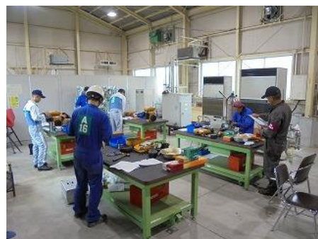
製作等作業試験の様子