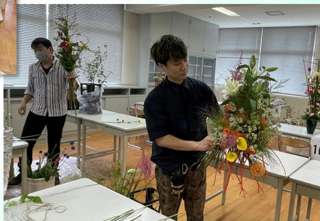
かごしま技能競技大会「フラワー装飾の部」競技風景