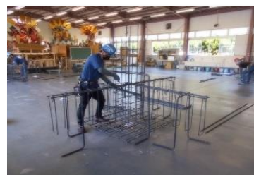
随時試験 鉄筋施工