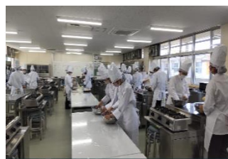
県立野田女子高等学校 (パン製造)