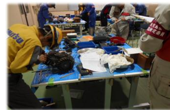
定期試験 建設機械整備

合格発表日に鹿児島県のホームページに技能検定合格者（実技試験・学科試験を両方とも合格された方）の受検番号が掲載されます。