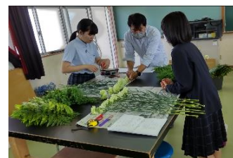
県立市来農芸高等学校 (フラワー装飾)