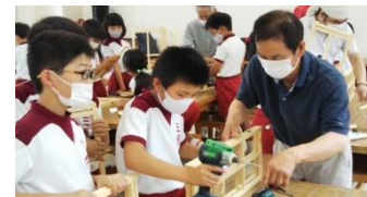
始良市立三船小学校（建具製作）