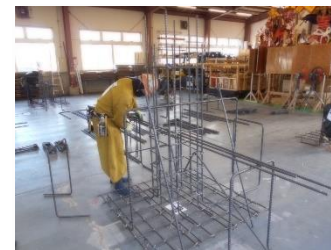
鉄筋施工 (鉄筋組立て作業)