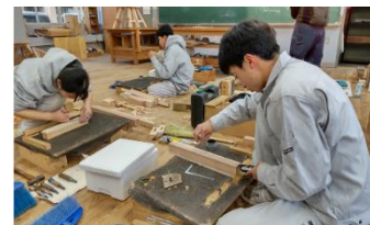
県立加治木工業高等学校（建築大工）