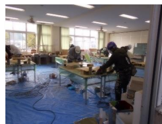
塗装 (鋼橋塗装作業)