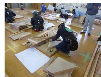
型枠施工 (型枠工事作業)