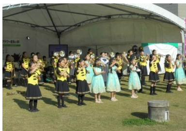
*武小学校金管バンド* オープニング演奏*