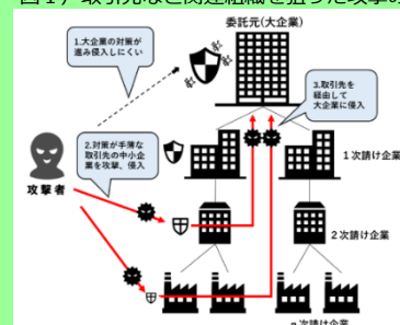
図1)取引先など関連組織を狙った攻撃の一例