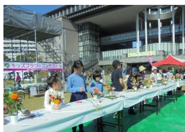
*キッズフラワーコンテスト*