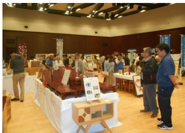
*職業能力開発施設等コーナー 展示*