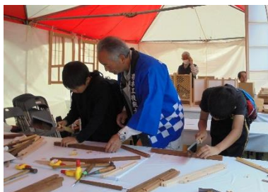
*ものづくり体験教室* (家具(木工))