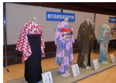
*職業能力開発施設等コーナー 展示*