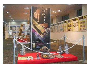
*技能競技大会展・技能士展*