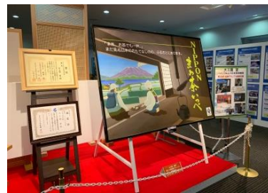
*技能グランプリ入賞者作品 展示*