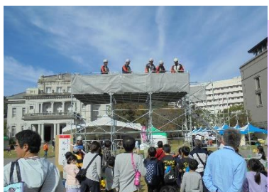
*特別企画 足場組立*