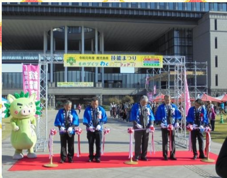
令和元年度技能まつり 開会式