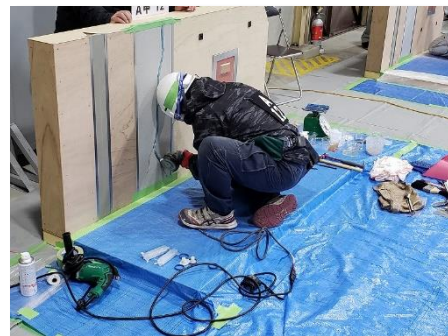
製作等作業試験の様子

また、技能検定では、樹脂接着剤注入施工職種において、検定委員や補佐員を務め、実技試験の材料準備や会場の設営等にもご協力頂くとともに、組合員へ積極的に受検勧奨されるなど、技能検定制度への取組により、今年度、知事表彰を受賞されました。