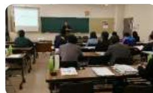
【職業能力開発推進者講習】