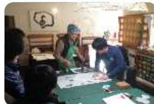
【表具内装組合連合会】