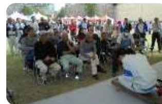
【大勢の観客が見守る中で】

A. 現場で女性の技能者に会うことが少ないので、もっと増えて欲しいと思います。そのためにも私自身、男性と同等に仕事ができるよう、一つ一つの仕事を確実に誠実にこなしていきたいと思います。これからも女性技能者が安心して働ける環境が整って欲しいと思います。