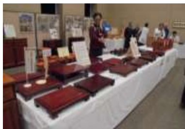
職業訓練生作品の即売