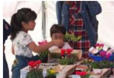
ものづくり体験教室 [造園]