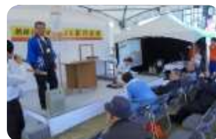
【技能まつり中央ステージにおいて】

A. ドアや障子など一般住宅や事務所で使われる建具を注文を受けて製作しています。既製品とは違い、お客様の好みや使い勝手など、様々なことを考えながら製作するので、大変ではありますがやりがいがあります。