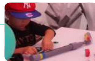
【技能まつり(水てっぽう)】

・ものづくり体験教室 17団体 2,550人参加 ・製作実演 18職種 18団体 中央ステージ 9職種 9団体