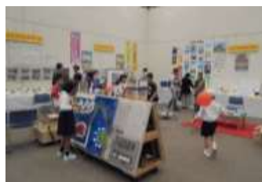
職業訓練校コーナー