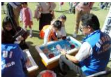
スーパーボールすくい 防水工事業協同組合