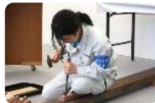
【家具製作1級の課題を実演】

高校生のとき、県外の家具製作会社への就職を考えていたのですが、実務経験がないと入れなかったため、それならと担任の先生が宮之城高等技術専門校を紹介してくださり、入学し今に至ります。