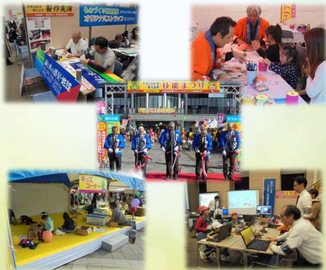
平成29年度技能まつり風景