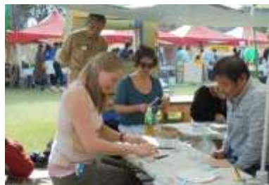
ものづくり体験教室 [畳]

11月12日(土)、13日(日) 於 かがしま県民交流センター 来場者数 約7,500名