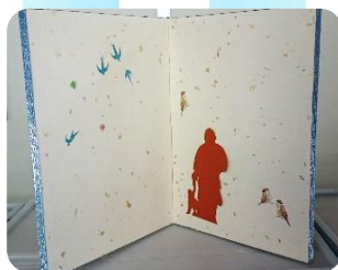
からくり屏風 (表装)