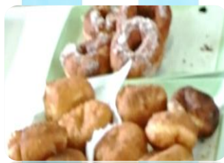
パン作り (パン製造)