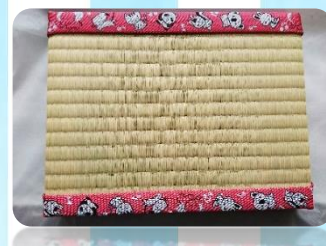
長方形ミ二畳 (畳製作)