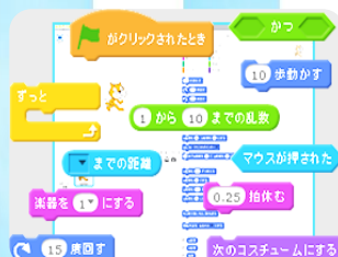
スクラッチプログラミング