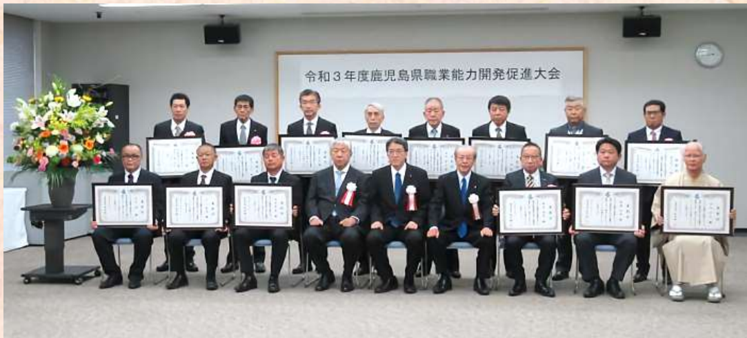
鹿児島県職業能力開発促進大会 鹿児島県知事表彰受賞者