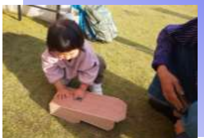
* ものづくり体験教室 * (建具)