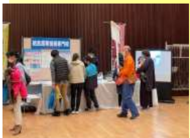
* 職業能力開発施設等 コーナー展示 *