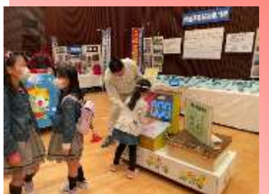
* 職業能力開発施設等 コーナー展示 *