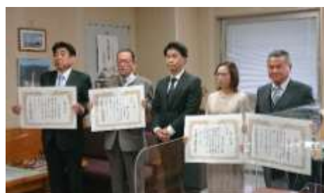
厚生労働大臣表彰受賞者