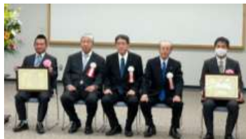
中央職業能力開発協会会長表彰受賞者