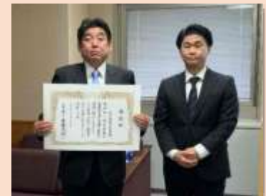
厚生労働大臣表彰伝達式において 平林商工労働水産部長と