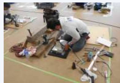
製作等作業試験の様子