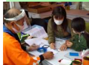
* ものづくり体験教室 * (室内装飾)