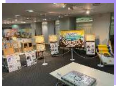
* 優秀技能者等 作品展示コーナー *