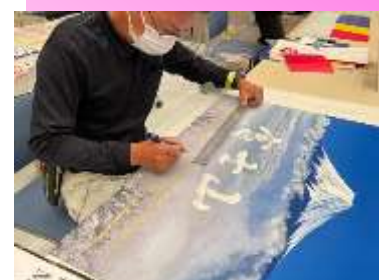
* 製作実演 (広告美術) *