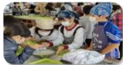
出水市立高尾野小学校（和菓子製造）