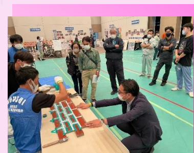
* 製作実演 (防水施工) *