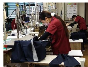
婦人子供服製造 (随時3級)