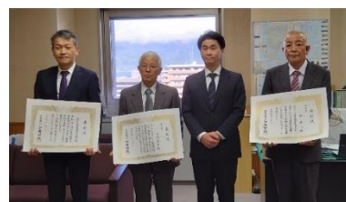
厚生労働大臣表彰受賞者