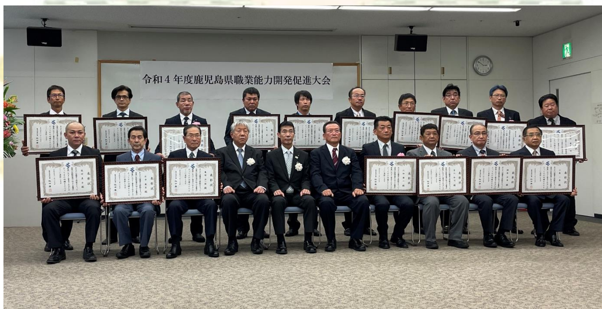
鹿児島県職業能力開発促進大会 鹿児島県知事表彰受賞者