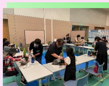
* ものづくり体験 * (造園)