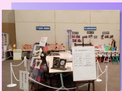
* 優秀技能者等 作品展示コーナー *