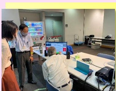
* 職業能力開発施設等コーナー *