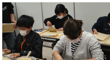
鹿児島市谷山北公民館（表装）