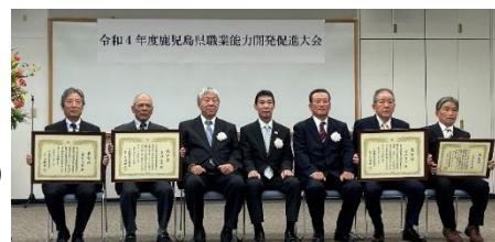
中央職業能力開発協会会長表彰・ 全国技能士会連合会会長表彰受賞者