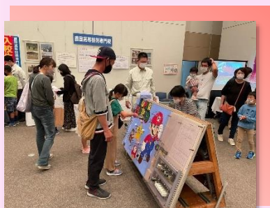
* 職業能力開発施設等コーナー *

11月12日（土）・13日（日）の2日間、かごしま県民交流センターで開催しました。今年度も、新型コロナウイルス感染症流行前と比べ、参加団体やものづくり体験参加者の定員などを縮小し、感染防止対策を徹底した開催となりましたが、683人の方々にご来場いただきました。ものづくりを体験した参加者からは「色々な技能士についての理解や知識が高まった」、「子供たちも大満足で、ものづくりに興味が深まった」などの感想をいただきました。ご協力いただきました参加団体の皆様、ありがとうございました。