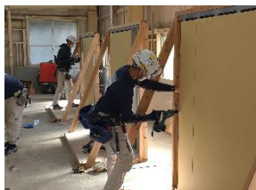
内装仕上げ施工 (基礎級)