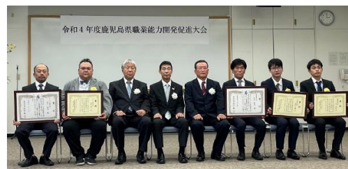
かごしま技能競技大会成績優秀者表彰受賞者