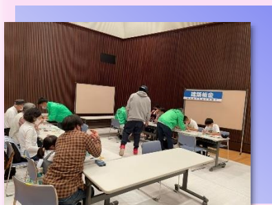
* ものづくり体験 * (建築板金)