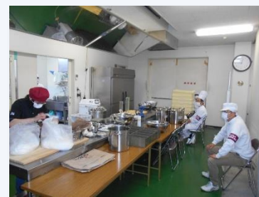
製作等作業試験の様子

パン製造業界の担い手を確保し、優れた技能士に育成することにより、技能継承やパンの安定供給に努めて、業界をさらに盛り上げていきたいと思っております。